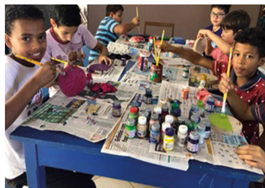
Cantinno de Sagrada Face de Jesus Brasilien