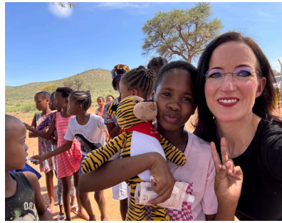
Einige Trost-Tiger haben unsere Reise begleitet und große Freude gebracht.